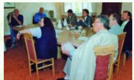
Bilder von der gemeinsamen Pressekonferenz der COOP Minden-Stadthagen und der MediCare Unternehmensgruppe zum Bauvorhaben Gesundheits- und Seniorenzentrum am Simeonsplatz

Die gesamten Investitionskosten betragen ca. 7 Mio €. Die Grundsteinlegung ist für August 2006 vorgesehen und die Eröffnung im September 2007.