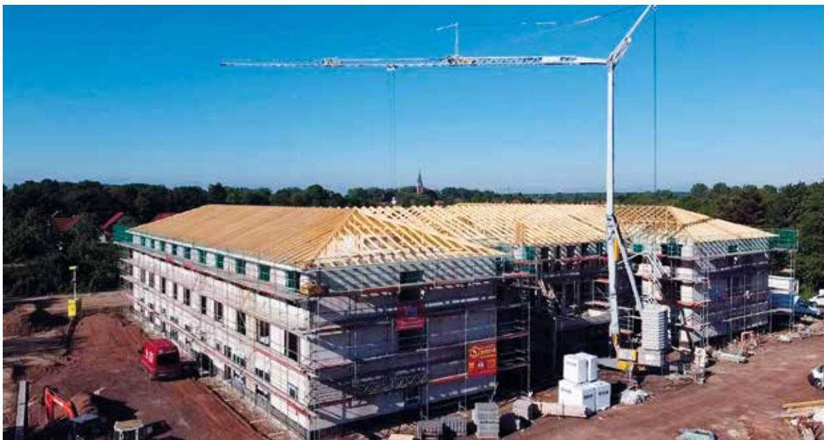
Neubau stationärer Wohngemeinschaften für Senioren in Petershagen-Lahde

Die co op aktiv GmbH erweitert ihr Engagement im Bereich der Pflegeimmobilien. Neben dem geplanten Bau einer Wohn- und Pflegeeinrichtung in Minden-Häverstädt wird in Petershagen-Lahde eine stationäre Wohneinrichtung für Menschen mit Pflegebedarf errichtet. In 2020 konnte ein Jahresergebnis in Höhe von 189 TEUR an die Genossenschaft abgeführt werden.