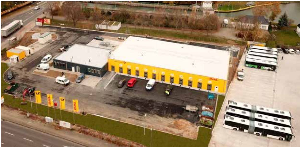
2020 – DHL-Zustellbasis auf dem Gelände der ehemaligen co op-Zentrale